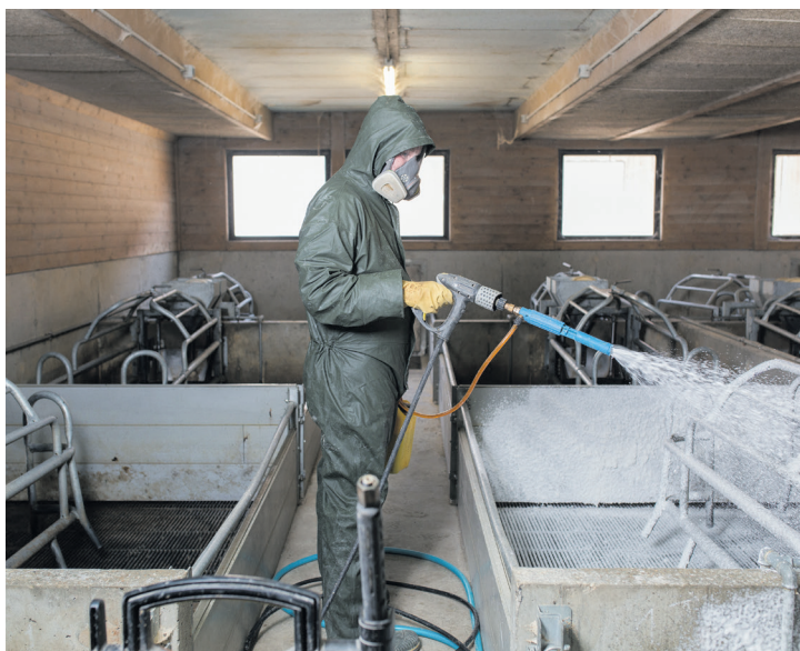
Ob Rationsgestaltung oder Arbeitsschutz bei der Stallreinigung: Der Austausch unter Berufskollegen bietet interessante Einblicke.

Wie haben sich die Entwicklungen von Futter- und Energiekosten auf die Wirtschaftlichkeit in meinem Betrieb ausgewirkt? Wie ist der Ausblick derzeit? Wie liege ich bei den tierischen Leistungen und bei den verschiedenen Kostenpositionen im Vergleich zu anderen Betrieben? In welchen Bereichen bin ich gut unterwegs? Wo muss ich ansetzen, um die Wirtschaftlichkeit weiter zu verbessern?