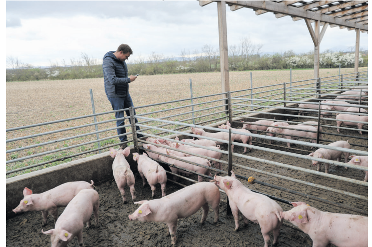
Meist sind es die „kleinen“ Hinweise und Tricks, die zum Ausprobieren mit nach Hause genommen werden.

In den kommenden Wochen finden beispielsweise Arbeits-